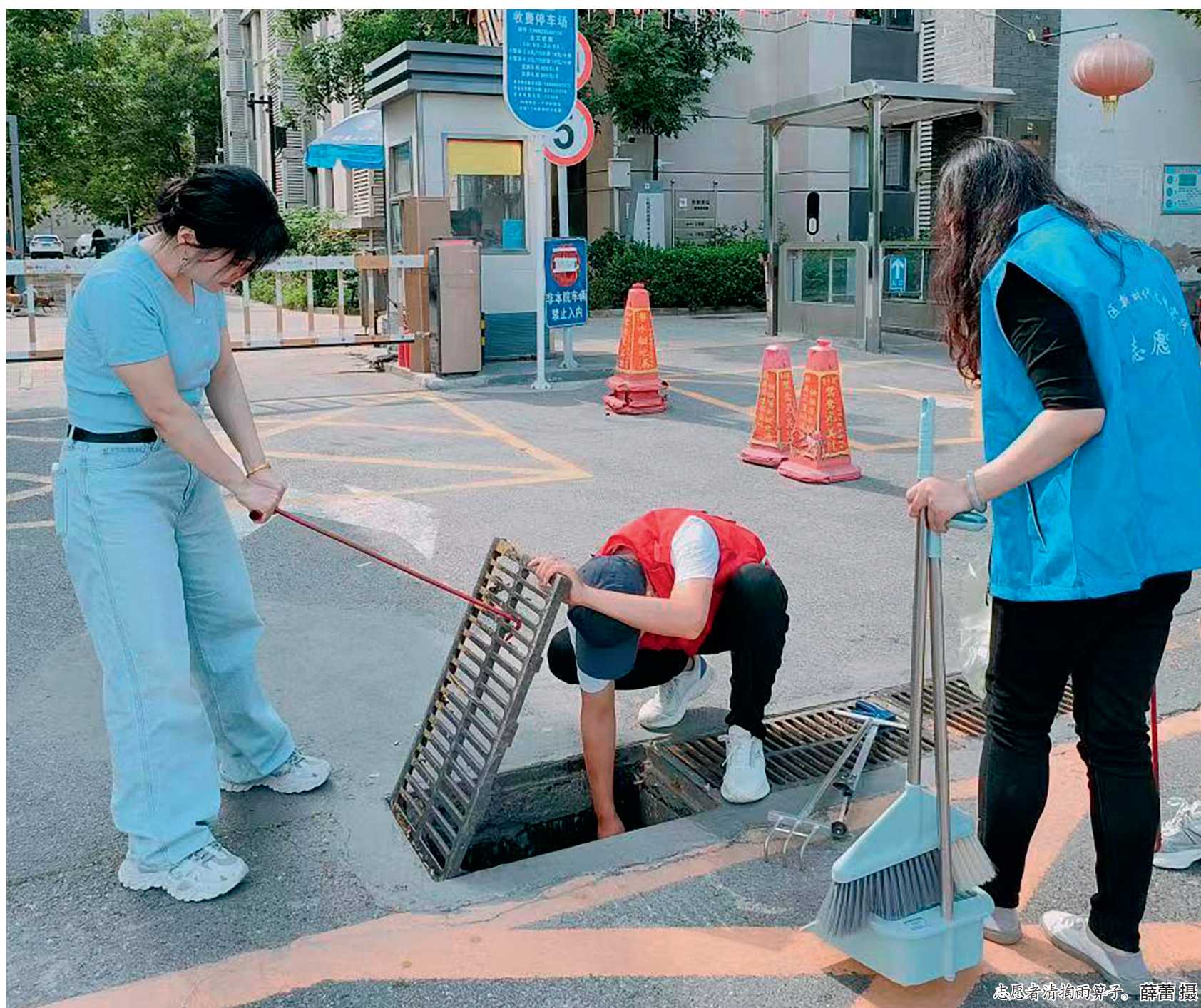
志愿者清扫雨篦子。

本报讯(通讯员 薛蕾)前几天,暴雨汹涌来袭,青塔辖区道路淤泥、杂物与积水等问题也伴随而来,给居民出行带来极大不便。为尽快恢复市容环境卫生,有效预防和减少雨后疾病发生,助力营造共建共治共享的社会氛围。8月5日上午,青塔街道新时代文明实践所联合辖区14个新时代文明实践站开展“清洁家园 共享健康”新时代文明实践主题活动。