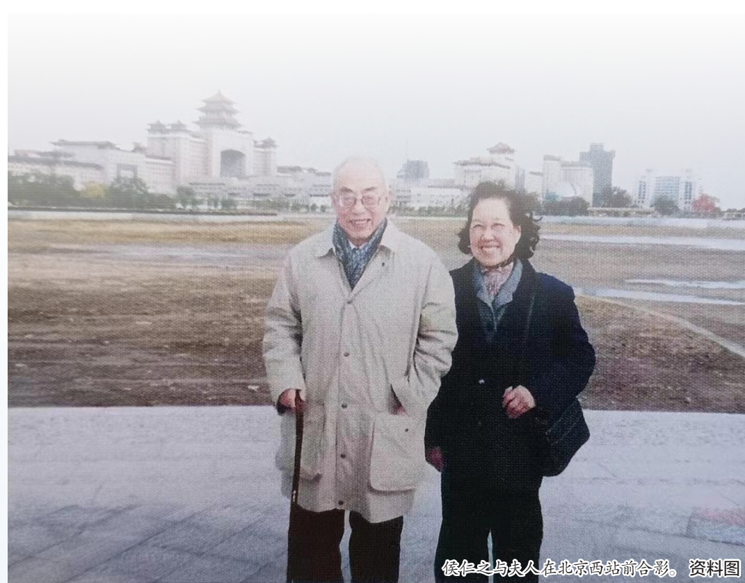
侯仁之与夫人在北京西站前合影。

当年7月7日《北京日报》的“图解新闻”版，用《再造京门》为标题，用精美图片生动地报导了正在建设中的我国最大的铁路客运工程——北京西站。待至返回燕园之后，侯仁之奋笔疾书，写下《莲花池畔再造京门》一文，建议进一步开发莲花池的水源，“北京西站选址在莲花池畔，只需要进一步开发水源，莲花池上平展如画的水面，必将为这号称‘京门’的交通枢纽带来无限的风光。同时，也将会产生良好的小气候效应。然而，更有意义的还是应当看到，莲花池在北京城的早期发展过程中所产生的重要影响……”